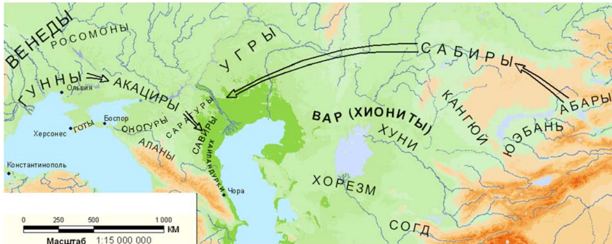
Sabirlərin (Savirlərin) Şimali Qafqaza hərəkəti

Şahənşah Kavad sürətli yürüşdə Cənubi Qafqaza doğru hərəkət etdi. Spahbəd Şapurunun komandanlıq etdiyi 12 minlik süvari ön qoşunu düşməni Arazla Şirvan arasında olan ərazilərdən (Mil, Muğan, Şirvan düzləri) çıxardı. 504-cü ilin yazında şahənşahın rəhbərlik etdiyi əsas qüvvələr yaxınlaşdı. Lakin savirlərlə mübarizə aparmaq çətin iş idi. Nəticədə, 505-ci ildə Bizansla sülh müqaviləsi imzalanmış və Qafqaza əlavə qüvvələr göndərilmişdi. 508-ci ilədək davam edən silahlı mübarizədən sonra sasanilər savirləri Qafqaz dağlarından geriyyə çəkilməyə məcbur etdi. Lakin 515-ci ildə savirlər Dəryal dərəsini keçərək yenidən Ön Asiyaya gəldilər və bu dəfə Mesopotamiya və Kiçik Asiyada Bizans torpaqlarını taladılar [25, s.36–39].