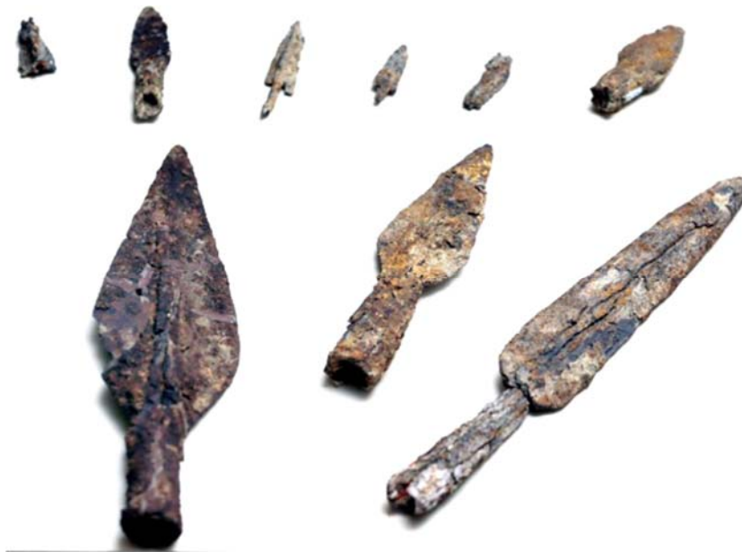
Alban döyüşçülərinin silahları

Hunlarda at yüyəni sadəformalı idi. Qantarğa sadəformalı olub, halqa və ya şaquli lövhə ilə tamamlanırdı. At ləvazimatına daxil olan qayıqlar müxtəlif detallarla bəzədilirdi ki, onlar da “kluazone” üsulu ilə tərtib olunurdu: tunc özülə qızıl və ya elektrofolqa çəkilir, yuvacıqlara Süleyman daşından bəzəklər bərkidilirdi. Belə halqalı qantarğalar yüyənlərin uzun sıxacları, rombvarı və ayparaşəkili lövhələr Şərqi Avropa çöllərində əvvəllərdə mövcud olmuşdur. Ehtimal ki, hunlar bu elementləri sarmatlardan mənimsəmişdilər [21].