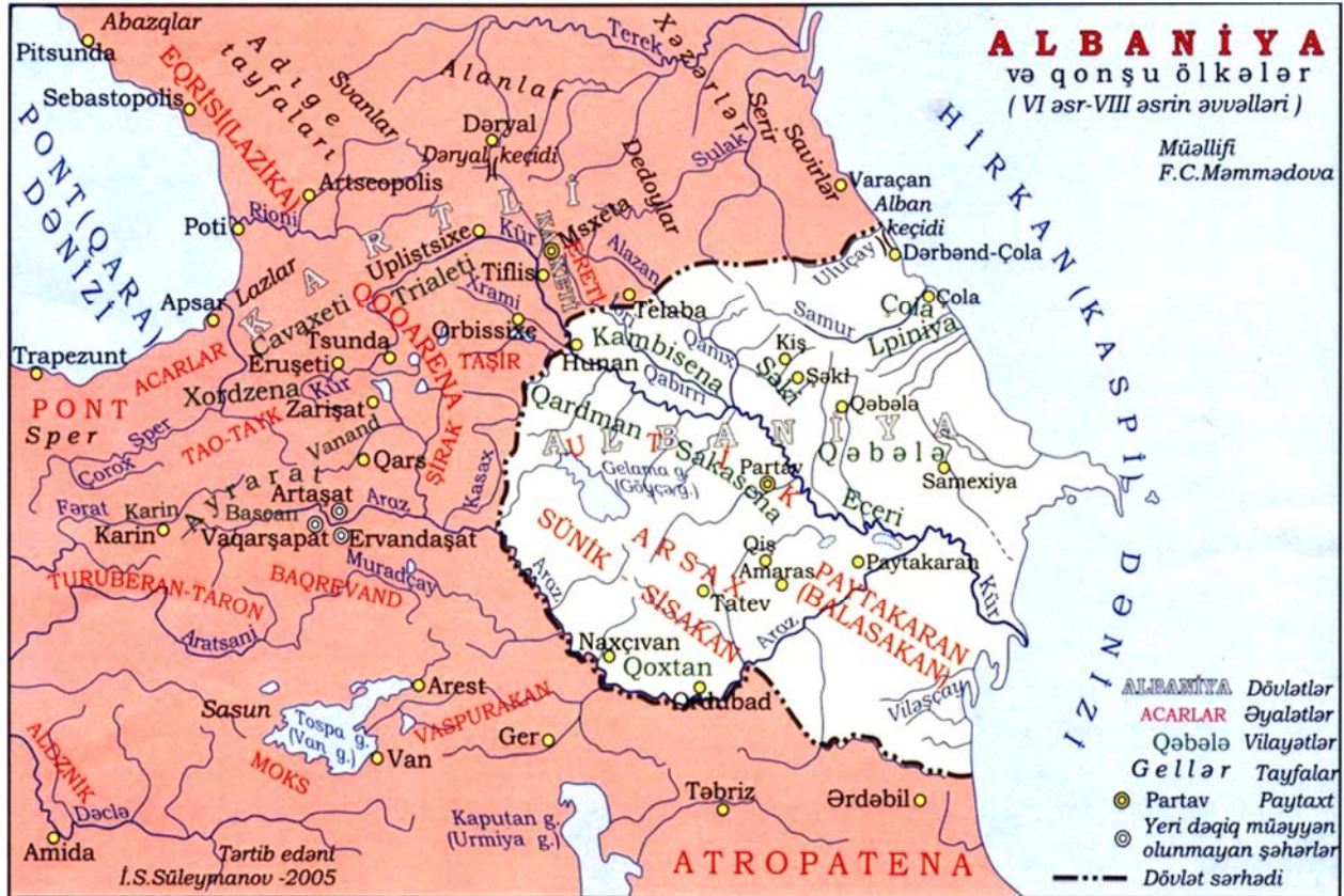
Albaniya və qonşu ölkələr. VI–VIII əsrin əvvəlləri

Atropaten və Albaniyanın ərazisi qanlı döyüşlər arenasına çevrildi. Albaniya döyüş əməliyyatlarında Sasanilər dövləti tərəfində iştirak edirdi. Bunun səbəbi həm alban çarı Urnayrın şahənşah II Şapurun (309–379-cu illər) qohumu (çar şahənşahın bacısı ilə evlənmişdir) və təbii müttəfiqi olması, həm də döyüş əməliyyatları nəticəsində çarın nüfuzunun beynəlxalq arenada və feodal əyanlarının nəzərində qalxması ilə bağlı idi.