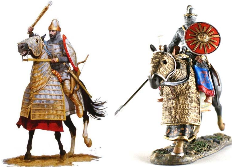
Sasani katafraktarisi (solda) və klibanarisi (sağda). Rekonstruksiya

qoşun oldu. O, təkcə zadəganlardan deyil, kiçik torpaq sahibkarlarından da formalaşdırılır və şah xəzinəsi hesabına təmin olunurdu. Ordunun əsasını bütün imperiyanın ərazisi üzrə yerləşdirilmiş və dərhal təhlükə olan tərəfə yönəlməyə hazır olan 12 ağır silahlanmış alay təşkil edirdi [8, s.21-23; 9, s.14-18]. Paytaxtda ölümsüzlər qvardiyasının korpusu yerləşirdi. Əhəməni dövründən fərqli olaraq, ölümsüzlər atlı qoşun idi. Xüsusilə mükəmməl yüngül silahlanmış atlılara malik türk tayfalarının müddə ilə cəlb olunmasına diqqət yetirilirdi. Lövhəli yaraqlar əvəzinə daha yüngül olan “pullu”, daha sonra isə halqalı yaraqların istifadəsinə başlanıldı. Atlılar əsas silah (dəbilqə, yaraq, qalxan, nizə, qılınc) başqa, yay və oxlarla silahlanmışdılar. Yaydan mükəmməl atəş açmaq üçün uzunmüddətli hazırlıq tələb olunurdu. VI əsrdə İrən oxçuları əla ox atır, kərişi (ox yayının iki ucuna tarım bağlanan ip) sinəyə deyil, qulağa qədər çəkirdilər. Təcrübəli oxçu dəqiqəyə iyirmiyə yaxın ox atırdı [10, s.96-97].