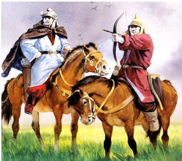
Hunlar. V əsr. Rəssam A.Mak-Brayd

Hunların hərbi strukturunun fərqləndirici cəhəti iri hərbi birləşmələrin – 10 min döyüşçüsü olan tümənlərin mövcudluğu idi. Tümənlər min döyüşçüsü olan dəstələrə bölünürdülər. Uzaq məsafədən yaylardan atəş açan tümən qarşısında dayanmayan istənilən düşməni məhv edirdi.