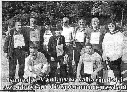
Kanada Vankuver şəhərindəki Azərbaycan diasporunun izlyeri

ukrain və tatarlar arasında geniş təbliğat işləri də aparılır. Otən illərdən fərqli olaraq, bu prosesdə bizimlə soydaş olan Anadolu, Krım, Doğu Türkmənistan, İraq, Türkmən, Qaraçay Türkləri də Azərbaycan haqq səsinə çox möhtəşəm şəkildə dəstək verir-