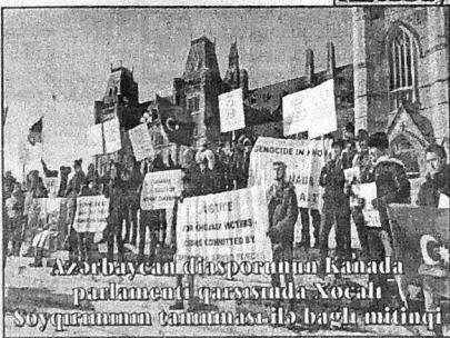
Azərbaycan diasporunun Kanada parlamentində qarşısında Xocalı Soyqırımının tanınması ilə bağlı mitinqi

daxil olan vergi deməkdir. Mehmanxanalar, istirahət mərkəzləri, turizm məkanları məhz bizlərin sayəsində neçə-neçə soydaşımızın həm də gəlir və yaşamaq mənbəyidir. Biz çox istərdik ki, ölkəmizdə başqa dövlətlərdə olduğu kimi turizm inkişaf etsin. İndi dünyanın bir çox ölkələrinin əsas gəlir mənbəyi həm də turizm və turizm sənayesi sayəsində inkişaf edir. Azərbaycanın təbii, onun coğrafi imkanları o qədər zəngindir ki, bunu dəyərləndirmək lazımdır. Bura həm də hər bir azərbaycanlının ruhunun məkanındır.