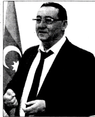
55. ARPISSA f.276, siy. 3, iş 209.