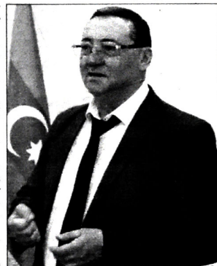
1934, № 34.

7. Bolşeviki v borjbe za pobedu sotsialisticheskoy revolyuui v Azerbayd-jane. Dokumenti i materialı 1917-1918 qq. Baku, 1957.