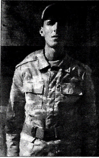
(Əvvəlki ötan sayımızda)