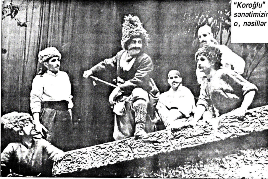
"Koroğlu" operası musiqi və opera sənətimizin mükəmməl bir abidəsidir ki, o, nəsillər boyu yaşayacaqdır