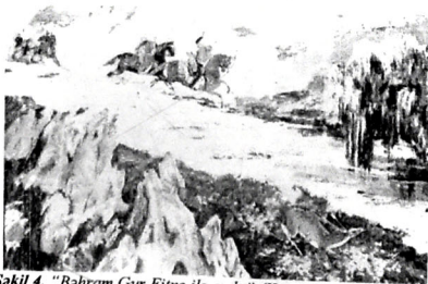
Şəkil 4. "Bəhram Gur Fitnə ilə ovdada" (Kətan, yağlı boya, 2002)

Rəssamın yaradıcılığında məşhur şairlərin əsərlərinə çəkilmiş kompozisiyalarda mühüm yer tutur. Nizami Gəncəvinin 7 gözəl poemasına həsr etdiyi "Bəhram Gurun 7 gözəl ilə" multikultural mövzusuna özünəməxsus yanaşmasını xüsusilə qeyd etməliyik. Silsiləyə daxil olan maraqlı tablolarından biri olan "Bəhram Gur Fitnə ilə ovdada" (Şəkil 4) əsərində milli və qərb təsviri sənət metodlarından, ustalıqla istifadə edilmişdi. Mənzərə önündə təsvir edilən ov səhnəsi miniatürlərimiz üçün ənənəvi süjetdir. Soyuq və isti rənglərin vəhdəti, məkan və perspektivanın qurulması kompozisiyada bitkinlik yaradır. Ov etmə səhnəsində kişi və qadın bərabərliyi, dinamika, rəngin ritmik olaraq təkrarlanmasını xüsusilə vurğulamaq lazımdır. Nizamının multikultural məzmunlu mövzusunu öz kətanına köçürən rəssam, rənglərin axıcılığını, ceyranın ov edilməsini, bütün bu təsvirləri nəzərdən yetirsək Firdovsinin məşhur "Şəhnaməsi"ndəki miniatürlərlə səsleşdiyini görə bilərik.