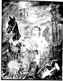
Şəkil 2. Tomris (karton, sulu boya)

Altay Hacıyev yaradıcılığında Natəvana həsr etdiyi silsilə əsərlərdə mühüm yer tutur. "Natəvan Düma ilə" (şəkil 3) adlı tablounununda şərq və qərbin əsas qəhrəmanınının şahmat oynaması səhnəsi canlandırılmışdı.