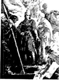
Şəkil 1. Tomris (kətan, yağlı boya, 2001)