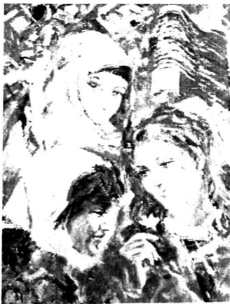
Şəkil 5. "Bakılı qızlar" (kətan, yağlı boya, 2005)

Altay Hacıyevin yaradıcılığında Bakıya həsr etdiyi tolerant baxışlı kompozisiyalarında yaradıcılığında mühüm yer tutur. Qədim və müasir Bakının memarlığının monumental şəkildə əks etdirilməsi tamaşanın diqqətini cəlb edir. Rəssamın "Bakılı qızlar" (Şəkil 5) kompozisiyasında Bakının simvolu sayılan Qız qalasının qarşısında, sanki qırmızı parçalardan qurulmuş üç gənc qız təsvir edilmişdi. Dairəvi formada "ağırlaşdırma" metodundan bu əsərdə istifadə edilmişdi. Azərbaycanlı qız öz başındakı örtüyüylə, utancaqlığı və əsl şərq xanımına məxsus olan baxışlarıyla seçilir. Sənətkar burada rus və erməni qızını əks etdirərək doğma Bakımızın tolerant şəhər olduğunu bir daha vurğulayır.