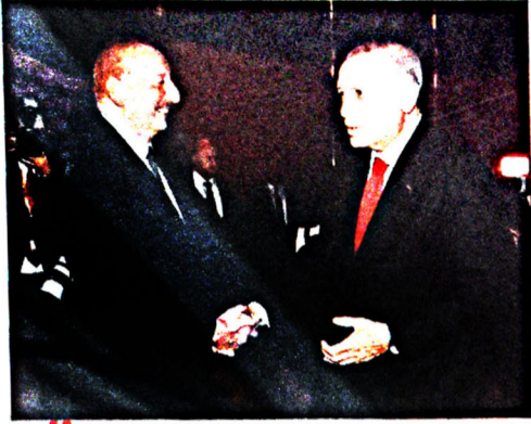
Ö ten il Bakıda ilk dəfə keçirilən "TEKNOFEST Azərbaycan" Aerokosmik və Texnologiya Festivalında "Bizim tariximiz parlaqdır və tariximiz ən önəmli anlarında biz bir yerdə idik. Xatırlayırıq, Bakının erməni işğalından azad edilməsinə həsr olunmuş hərbi paradı Azərbaycan əsgərləri çiyin-çiyinə Azadlıq meydanına çıxmışdılar. Bunun təkrarını biz 2020-ci ildə Zəfər paradında gördük.

gələcəyini düşünən, xalqını daim irəliləyən lideri vardır. "TEKNOFEST Azərbaycan" festivalında dövlət başçısı İlham Əliyevin "Bir də təvazökarlıqdan kənar olsa da, hesab edirəm ki, bu gün daha iki nümunə var - o da mənim qardaşım mən. Biz ölkəmizi müstəqillik yolu ilə irəliləyən aparırıq. Mən dəfələrlə demişəm ki, Türkiyənin artan gücü bizi gücləndirir və biz bir-birimizə güc qataraq böyük dünya çərçivəsində bir güc mərkəzinə çevrildik. Türkiyənin uğurlu inkişafı, ilk növbədə, Prezident Rəcəb Tayyib Ərdoğanın adı ilə bağlıdır. Mən də öz fealiyyətimdə həmişə çalışmışam ki, Azərbaycan xalqının və dövlətinin milli maraqlarını müdafiə edim, Azərbaycanın müstəqil siyasətini təmin edim. Bizim aramızdakı qardaşlıq bütün Türkiyə və Azərbaycan xalqına ömək olmalıdır. fikirləri də deyilənlərin təsdiqidir.