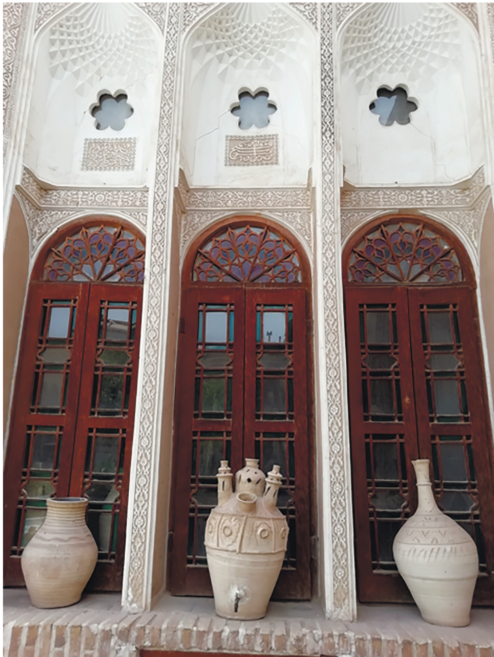
5. Mukarnasy, shebeke, plastic wall decor, ceramics, decorative carpets and furniture of the central courtyard-miansara of a traditional Iranian house.