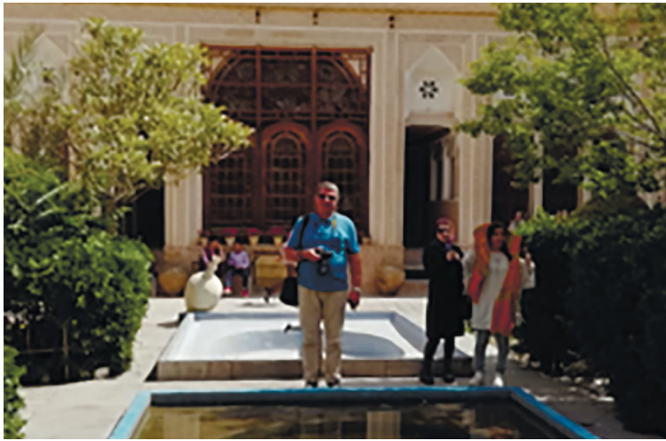
3. Miansara courtyard with a goldfish pool of a traditional Iranian closed house..