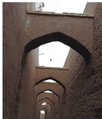
1. Reconstruction of Persepolis, a model of the city of Yazd with adobe development, the tradition of which dates back 5,000 years, and its narrow streets.