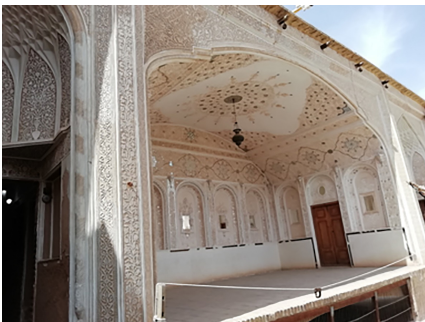
4. Wood carvings and alabaster carvings in the decoration of the courtyard-miansara of a traditional Iranian house.