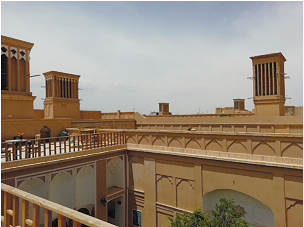
2. Badgir (wind-blowing towers) over traditional Iranian closed houses.