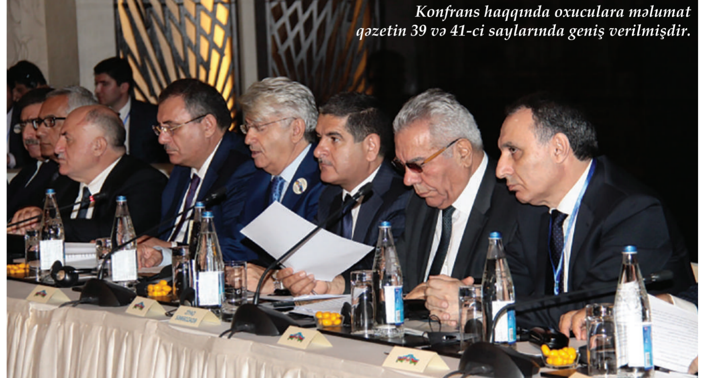
Konfrans haqqında oxuculara məlumat qəzetin 39 və 41-ci saylarında geniş verilmişdir.

2017-ci ilin 21-23 sentyabr tarixlərində Bakı şəhərində Azərbaycan İqtisadçılar İttifaqı və Azərbaycan Respublikası Auditorlar Palatasının birgə təşkilatçılığı ilə "Azərbaycan iqtisadiyyatının strateji yol xəritəsi: hesabatlıq və şəffaflıq problemləri" mövzusunda beynəlxalq elmi-praktik konfrans keçirilmişdir.