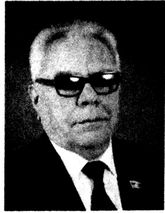
Ziyad Səmədzadə, akademik

Bu gün bütün şərq dünyasında güclü mövqeyi, rolu olan ən məşhur alimlər, islam dininin professional tədqiqatçıları və təbliğçiləri Vasim müəllimlə görkəmli bir alim, dərin tədqiqatları ilə seçilən şərqşünas-ərəbşünas ustad kimi hesablaşırlar.