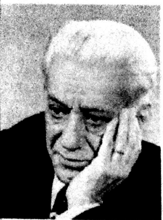
Bəxtiyar Vahabzadə, Xalq şairi