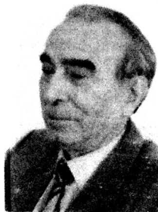
Hüseyn Abbaszadə, Xalq yazıçısı