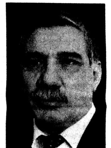
Zəlimxan Yaqub, Xalq şairi

Qarşında hörmətlə ayılır başım, Sandaki o səsə, üna qurbanam, Kərbəla sirdaşım, Kəbə yoldaşım, Səni tapdıgım günə qurbanam. Söz gözün işığı, ürəyin yağı, Sevginin zirvəsi, həsrətin dağı, Nəsimi dəryası, Hafiz bulağı, Mövlana camısan,