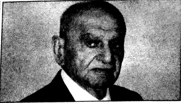
Şeyxülislam Hacı Allahşükür Paşazadə, Qafqaz Müsəlmanları İdarəsinin sədri