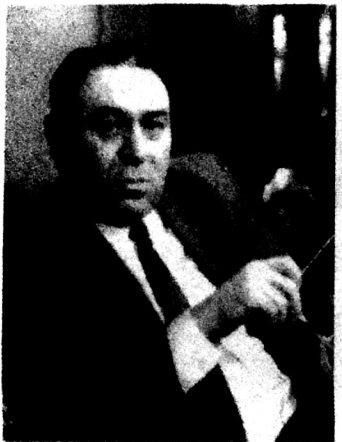
Nəbi Xəzri, Xalq şairi