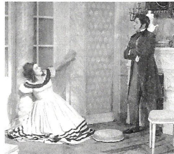
«İki qardaş», Mixail Lermontov. Quruluşçu rejissor Şəmsi Bədəlbəyli. Tamaşadan səhnə

Musiqili Komediya Teatrında hazırladığı əsas tamaşalar: «Məşədi İbad», «Ar-