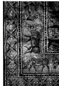
Лани на пастбище, фрагмент ковra

Санкт-Петербургский международный культурный форум - центральное событие культурной жизни страны. Это международная площадка для встреч, открытого диалога и обмена опытом между специалистами в области культуры и культурной политики, представителями государственной власти, политиками и бизнесменами разных стран. Форум - это пространство для продвижения инновационных идей в российском и международном культурном контексте, презентаций культурных проектов и демонстраций достижений разных стран в области искусства. Организаторы форума - правительство Российской Федерации, Министерство культуры Российской Федерации, правительство Санкт-Петербурга.