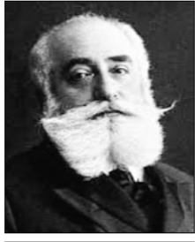
■ Maks NORDAU