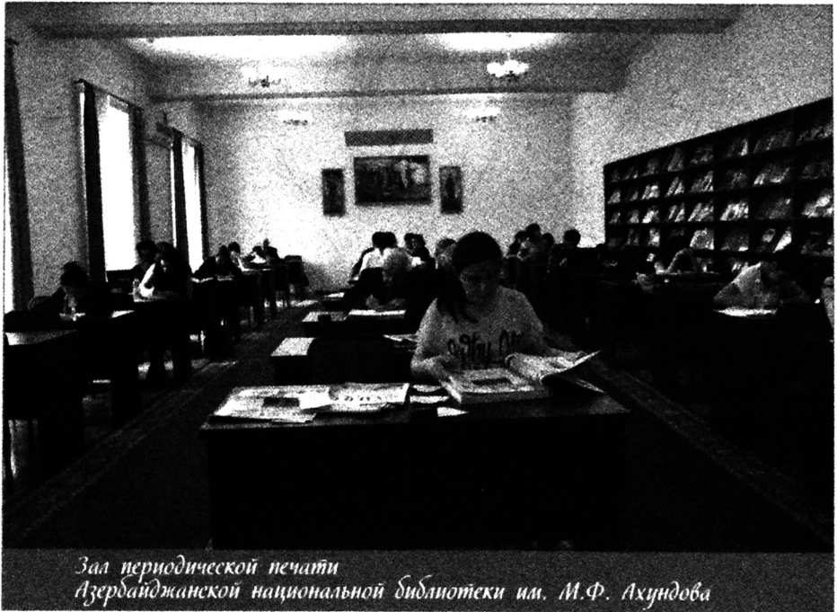
Зал периодической печати Азербайджанской национальной библиотеки им. М.Ф. Ахундова

Наряду с электронными версиями книг, газет и журналов в НБА созданы базы электронных версий музыкальной литературы и нотных изданий и предоставлены в пользование читателям в секторе