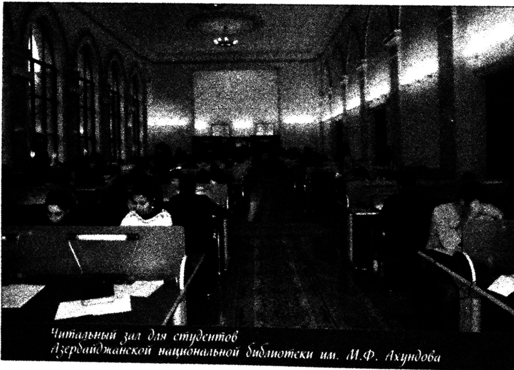
Читальный зал для студентов Азербайджанской национальной библиотеки им. М.Ф. Ахундова

В 2003 г. в Азербайджанской национальной библиотеке им. М.Ф. Ахундова начала работать автоматизированная система управления на базе библиотечно-информационной программы VIRTUA, с успехом применяющейся в самых крупных и известных библиотеках мира. В НБА открылись новые отделы: «Электронно-информационное обслуживание», «Организация инфраструктуры и программного обеспечения», «Автоматизация и информационные технологии», «Создание электронных ресурсов», «Организация аналитической электронно-информационной базы», «Формирование электронного каталога», «Организация электронно-диссертационного фонда и его использование»: новые сектора: «Организация использования электронных ресурсов», «Читальный зал по использованию локальной сети», с появлением которых многие традиционные методы работы претерпели качественные изменения, традиционный каталог постепенно заменялся электронным, была создана электронная библиотека.