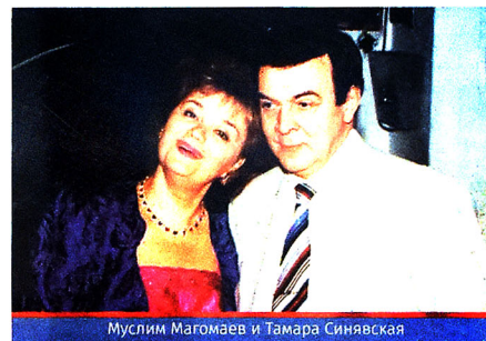
Муслим Магомаев и Тамара Синявская

Что же касается ставшей притчей на языках скромности М.Магомаева, то об этом лучше и нагляднее, чем такой знаток искусства, как Гейдар Алиев, никто не мог бы сказать. Выступая на торжествах по случаю 60-летнего юбилея Муслима Магомаева, Гейдар Алиев в своей обстоятельной речи отметил: «Имя такую славу, репутацию, Муслим оставался застенчивым. За период нашего общения он никогда не исполнял наших дружеских отношений для решения своих вопросов и никогда не распространялся о своей дружбе с Алиевым. Это говорит о нем как о человеке, о его характере». Столь же высокой была оценка Гейдаром Алиевым магомаевского творческого дарования. Остановившись на песне «Азербайджан», созданной М.Магомаевым на