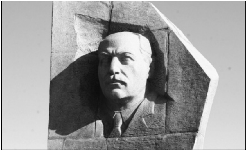
Ulyanovskdakı abidənin fraqmenti

Nəriman Nərimanovun həyat və yaradıcılığını özündə əks etdirən rəngkarlıq və qrafika nümunələri təkcə onun xatirə muzeyində toplanmayıb. Həmin əsərlər həm də