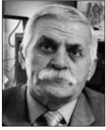
■ Ziyadxan Əliyev Azərbaycan Respublikasının eməkdar incəsənət xadimi, sənətşünaslıq üzrə fəlsəfə doktoru