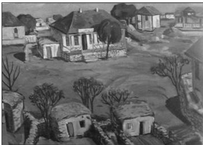
Ə.Rüstəmov: Nərimanovun işlədiyi Qızıl Hacılı kəndi