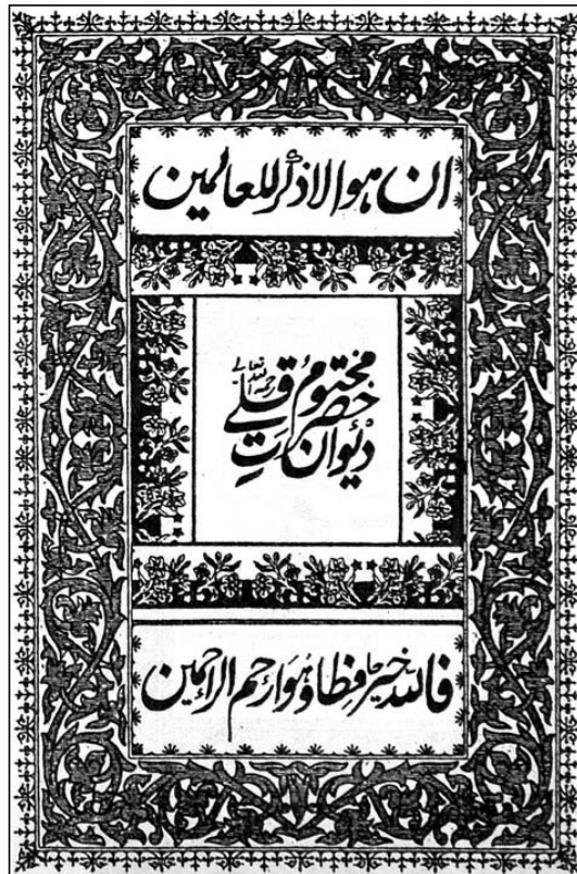
Divanın üz qabığı