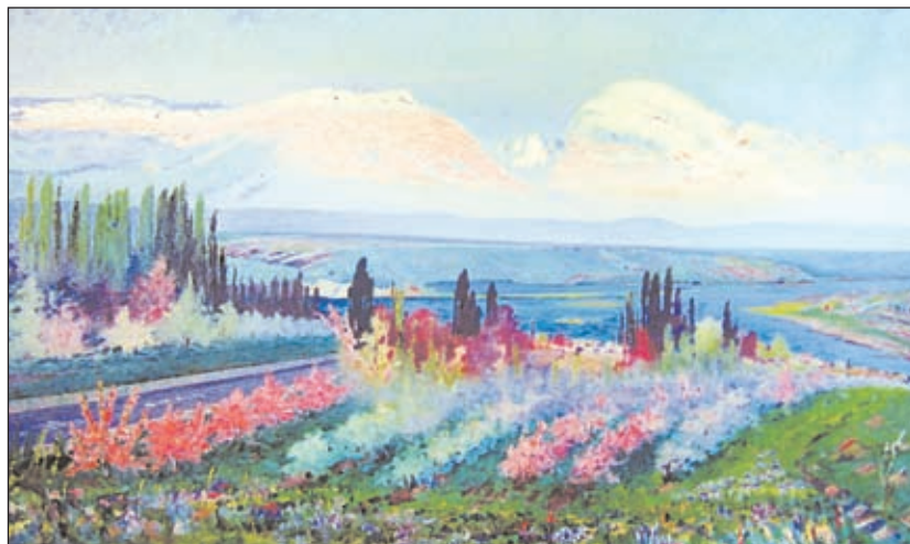
Bahar nəğməsi. (1957).