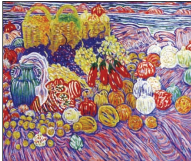
Abşeron natürmortu. (1973).

"Mən ilham və natura ardınca Qogen kimi baş götürüb Taiti adasına getmirəm və bunu başqalarına da məsləhət görməzdim. Çünki doğma xalqın həyatı, Vətən torpağı əsl ilham mənbəyidir". Bu Səttar Bəhlulzadənin yaradıcılığını seçiyələndirən və doğma Azərbaycan torpağına sevgisini əks etdirən öz sözləridir. O, doğrudan da bir qərinalıq yaradıcılığı ilə