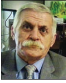
Ziyadxan Əliyev Azərbaycan Respublikasının əməkdar incəsənət xadimi, sənətsünaslıq üzrə fəlsəfə doktoru

Hələ sağlığında müasirləri onu "aramızda gəzən dahi" deyər çağırırdılar. Özünün bundan xəbəri yoxdu. Bilsəydi inciyərdi. Tərifləri xoşlamazdı. Çəkdiyi əsərləri özünə tərifləyəndə də haldan-hala düşər, daxili aləminin işığı duyulan nadir gözçərini nəhayətsiz bir nöqtəyə zilləyərək "işləyirik də... hələ çox şey ələmək lazımdı" deyib söhbətin yönünü dəyişməyə çalışırdı.