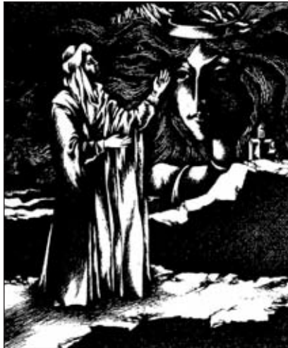
Arif Hüseynov -Şeyx Sənan