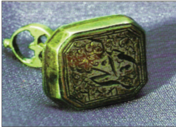
Möhür-kitab nişanı. XIX əsr