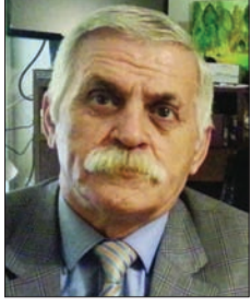
Ziyadxan Əliyev Azərbaycan Respublikasının əməkdar incəsənət xadimi, sənətşünaslıq üzrə fəlsəfə doktoru

Öncə deyək ki, kitab nişanlarının indiki müasir adı - "ekslibris" sözü latınca "kitablarından" mənasını verir. Bu da ekslibrislərin hazırlanmışından sonra onların kitabların iç tərəfinə yapışdırılması ilə əlaqədar olmuşdur.