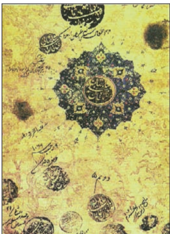
Qədim əlyazmasına çəkilmiş nişan. XVI əsr

rixi orta əsrlərə gedib çıxan ekslibrislərin meydana gəlməsi ilk növbədə Şərqdə kitab mədəniyyətinin inkişafının yeni mərhələyə qədəm qoyması ilə bağlı olmuşdur. Belə ki, əgər əvvəllər əlyazmalarının üzərindəki hər hansı yazı ilə onun kime məxsusluğu bildirilirdisə, sonralar tərtibatçılar bu qeydə bədii forma verməklə, "ekslibris" adlandırılacaq bu nişan-elementi kitabın ayrılmaz hissəsinə çevirmiş oldular.