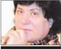
Flora XƏLİLZADƏ əməkdar jurnalist

A zərbaycan pedaqoji, mətbuat, ədəbiyyat və ictimai fikir tarixində görkəmli yer tutan Şəfiqə Əfəndizadə fanatizmin, cəhəlin hökm sürdüüyü, qadınların hüquqsuz sayıldığı bir zamanda xalqın maariflənməsində, xüsusilə də qızların təhsilə cəlb olunmasında minbir əziyyətlə qatlaşaraq mübarizə aparıb. Əlbəttə, bu zərif xanımın fədakarlığı təzyiqlər və təqiblərə də onun həyatından əsik etməyib.