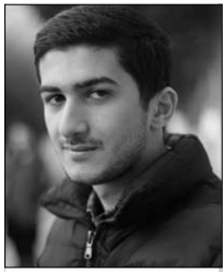
■ Emin Əliyev tələbə - teatrşünas

Bu dəfə Dünyanın teatr dahilərindən biri, Brextdən sonra siyasi teatrın ən tanınan nümayəndəsi, bəşəri sülh yolunda öz addımlarını atan, insanlığın ayaq üstə qalması, istismarın, zülmün məhv olması üçün teatr sahəsində islahatlar etmiş şəxsə - Avqusto Boaldan yazacağam.