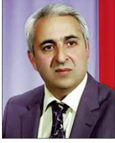
■ Nizami Muradoğlu

Xəlil Rza Ulutürk azadlığın və türkçülüynün ən fəal təbliğçilərindən biri idi. Şairin şeirlərində türkün şanlı tarixinə işıq tutulur, milli məniyyətimiz millətə xatırladılır, mübarizə çağırışları eşidilir. Xəlil Rzanın 1988-ci ildə milli azadlıq hərəkatı ilə başlayan mücahidliyi respublikanın hər yerində görünürdü. 20 Yanvar hadisələrini dünya ictimaiyyətinə çatdırmağa çalışan şair "Qanlı cəllad Mixail Sergeyeviç Qorbaçova" şeiri ilə Qorbaçovu və mənfur imperiyanı ifşa edirdi. 26 yanvar 1990-cı ildə guya milli ədavəti qızıqırdığına görə həbs