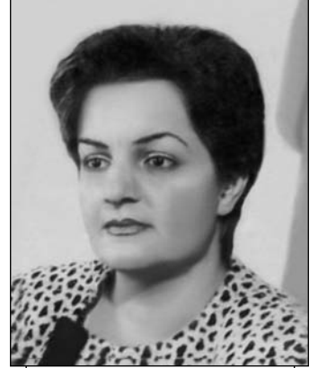
Qərənfil Dünyamin qızı Əməkdar jurnalist

Bu göstərişlər, məktublar sanki "göz-dən pərdə asmaq" üçün idi. Əslində hö-