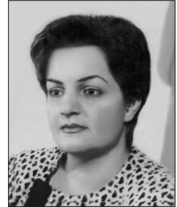
Qərənfil Dünyamin qızı Əməkdar jurnalist

Əvvəla, onu qeyd etmək istərdim ki, Azərbaycanda bir çox məşhur soyadlar olub ki, onlar məarif və mədəniyyətimizin inkişafında böyük rol oynayıblar. Bu soyadlardan biri də Şahsuvarovlardır.