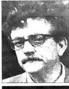
■ Kurt Vonnegut