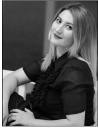
■ Xəyalə Rəis teatrşünas

Nədənə qardaş ölkə Türkiyədə baş verən yaradıcı proses bizə hər zaman maraqlı görünüb. Onların film, serial sektorunda birdən birə atdığı sürətli addım isə nəinki bizim sevgimizi qazanıb, dünya kinosuna öz damğasını vurmağı bacarıb. Ötən ay məşhur türk aktyoru Haluk Bilginer rol aldığı "Şəxsiyyət" serialındakı obrazına görə dünyaca məşhur olan "Emmy" mükafatına layiq görüldü. O serialdakı obrazına görə "ən yaxşı kişi aktyor" nominasiyasının qalibi olub. 21 ölkədən 11 kateqoriyada 44 namizədin yer aldığı siyahıda H.Bilginer serialdakı Ağah bəy rolu ilə namizəd göstərib. Mükafat alarkən sevincini dilə gətirən aktyor, belə mötəbər bir mükafatın Türkiyəyə gedəcəyi üçün fərh hissi keçirdiyini deyib: "Seviniyəm. Özümdən çox bu mükafatın Türkiyəyə getdiyi üçün xoşbəxtəm. Sevərək və bəyənərək gördüyümüz bir işin beynəlxalq platformada dəyərləndirilməsi və mükafatla təclandırılması insanı xoşbəxt edir". Serial yayımlamağa başladığı dövrlərdə Haluk Bilginer "Hürriyyət" qəzetinə bununla bağlı müsahibə