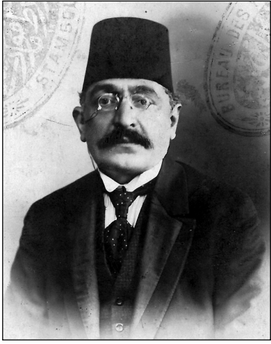
■ Əhməd bəy Ağaoğlu

Azərbaycanlı ictimai-siyasi xadim Əhməd bəy Ağaoğlu 1930-cu illərdə bir-birinin ardınca itirdiyi dostları haqqında xatirə yazılar dərc edib. Bu məqalələr Türkiyənin ən məşhur qəzetlərindən olan "Cümhuriyyət" də çap olunub. Hələ Bakıda ikən dostlaşdığı Müəllim Cövdət, Türk Ocaqlarından və "Türk Yurdu" jurnalından tanıdığı Cəlal Sahir və Yusuf Akçura haqqında yazdığı məqalələr Ağaoğlunun ahlı çağında ikən əzab verən yazıları olub. Necə ki, Akçura ilə bağlı yazdığı məqaləsində bildirir: "Fəqət həyatın bu nə qəribə, nə anlaşılmaz cəlvəsidir ki, hamısından ixtiyar və hamısından çox yaşlı olduğum halda onlar gedir, mən qalırım! Bu da talenin mənə qarşı göstərdiyi mərhəmətsizliklərdən birimi?".