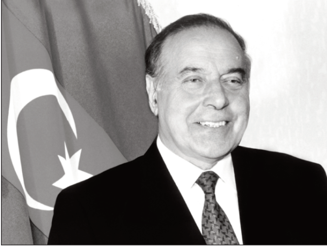
(Əvvəli 3-cü səhifədə)

“Bilirsiniz” modal sözü ilə həmişəki kimi insan fəlsəfəsinə keçir. İnsanın öz düşüncələrində, fikirlərində sərbəst olması ideyasını ön planda saxlayır. Heydər Əliyev böyüklüyünə xas olan bir dillə təvazökarlıq və səmimiyyətlə bağışlaya bilir, hər kəsi öz vicdanı ilə baş-başa qoyur; “Bilirsiniz” modal sözü bö-yük natiqin nitqində gah fəlsəfi fikirlərin, gah siyasi plüralizmin, gah da adi məişət məsələlərinə münasibət tələb olunan məqamlarda işlədilir;