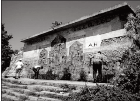
Cəbrayıl, "Dostluq bulağı"