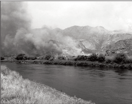
Xələfli kəndinin (Diri dağı) yandırılması

2020-ci il sentyabr ayının 27-si müharibə başlamışdı. "Dağlıq Qarabağ" müharibəsi idi. 27 sentyabrdan dünənki - 09 noyabra qədər işğaldan azad olunan rayonlarımız -Cəbrayıl, Füzuli, Zəngilan, Qubadlı və Şuşa rayonlarımız alınmışdı. Bu gün (10 noyabr) ən gözəl xəbər verilmişdi. "Qarabağı aldıq" xəbərini eşidəndə elə çox sevindim ki, az qala sevincimdən göylərdə uçacaqdım. Bəbam Əli Rza Xələflinin "QARA BAĞIM, QARA-BAĞIM" şeirini özümün qəlbimdən gələn səs kimi eşidirəm, oxuyuram: