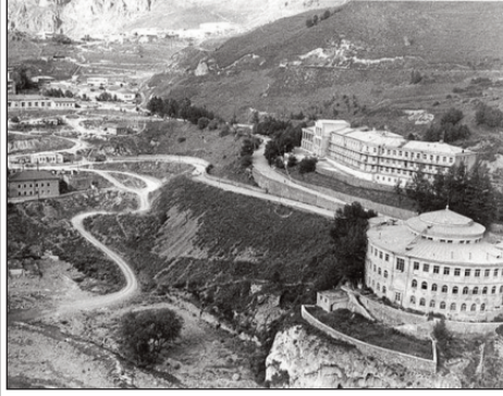
Kəlbəcər, işğaldan əvvəl