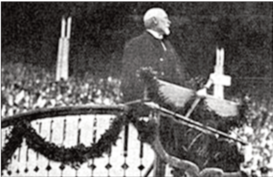
Çakste çıxış edir, 1926.