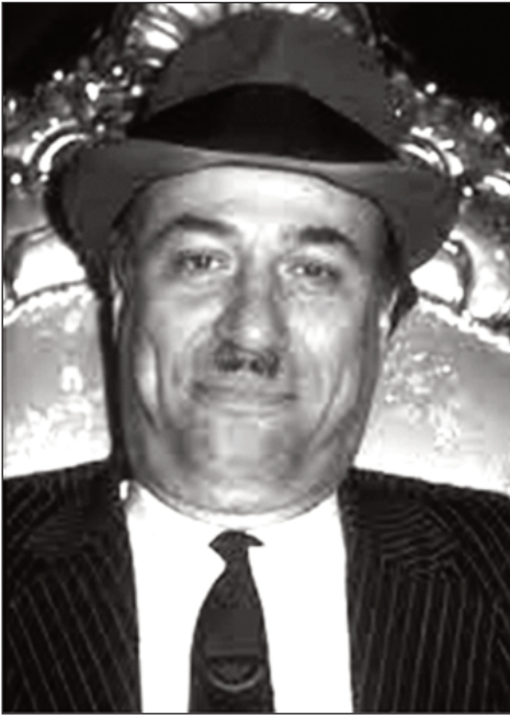
Kamal Sunal "Varyeməz" filminə çəkilərkən, 1991

Onda bu serialda nədən danışdırlar? Ədliyyənin rüşvətindən, ədalətsiz qərarlardan, neçə ailənin ayrılmasından, neçə günahsızın həbs olunmasından, neçə günahsızın da həbsdən qaçmasından danışır bu serial. Əslində, Kamal Sunalın əsərləri