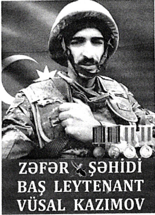
ZƏFƏR ŞƏHİDİ BAŞ LEYTENANT VÜSAL KAZIMOV

...Həznilik duyulan bir payız günündə ibadətə olarkən telefonum səsləndi. Nədənə, bu dəfə həmişəkindən tez açdım və "alo" dedim. Telefonda aram-aram oxunan "Yasin" ibadətində uzlaşdığın qeyri-iradi "amin" deməyə başladım. Az sonra telefonuma bir başdaşımın fotosu gəldi. Qara mərmərdəki yazını oxuyanda qübarlı qəlbim doluxsundu. Cavanlar itirmiş dərdi insan kimi içimdə tanımadığım gəncə "ruhun şad olsun" dedim.