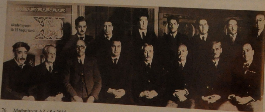
Akademiyanın ilk 15 həqiqi üzvü

– 1977-ci ildə Nobel mükafatı Komitəsinin Azərbaycanın iki böyük aliminə – analgeziyanın banisi Mustafa bəy Topçubaşova və tibb tarixinə “Qəhrəmanov metodu”, “Qəhrəmanov fistulaları”nın yaradıcısı, Neyrofiziologiya laboratoriyasının rəhbəri Qəhrəman Qəhrəmanova məktub gəldi. Kaşfları barədə rus və ingiliz dillərində məlumat və digər lazımı sənədlər göndərilməsi tələb olunurdu. Anketdən əlavə, Stokholma onların “Uzunmüddətli analgeziya – səhiyyə və fiziologiyanın problemi” kitabı göndərildi. Bir müddət sonra xəbər gəldi ki, materiallar baxılmaq üçün qəbul olub, nəticə barədə məlumat verəcək. Lakin 1978-ci ildə mükafatın təqdim