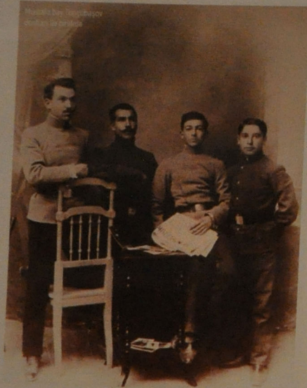
Mustafa bəy Topçubaşov sənəti, arxivdən