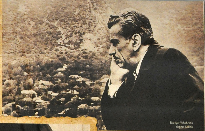
Bəxtiyar Vahabzadə doğma Şakıda