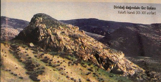
Diridağ dağındakı Qız Qalası Xələfli kəndi (XII-XIII əsrlər)

Bu rayonun adamları həmişə təmiz əqidəsi, torpağa bağlılıqları, elm, təhsil və mədəniyyətə diqqət və ehtiramları ilə fərqlənilir