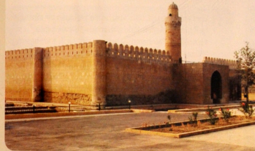
Qobustan dövlət tarixi-bədii qoruğu