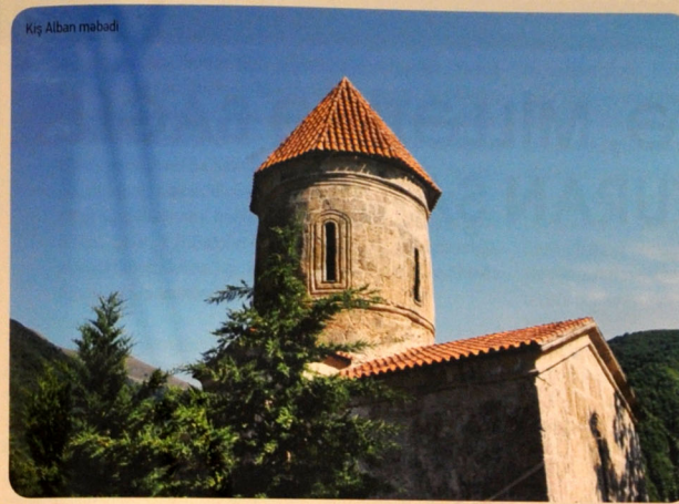
Kiçik Alban məbədi

Milli-mədəni dəyərlərimizin qorunması istiqamətində reallaşdırılan bu layihələr, gerçəkləşdirilən çoxsaylı tədbirlər hər birimizdə xüsusi fərəh hissi doğurmaqla yanaşı, həm də belə bir inam tələqin edir ki, “Azərbaycan 2020: gələcəyə baxış” inkişaf Konsepsiyasına əsaslanan “Daşınmaz tarix və mədəniyyət abidələrinin bərpası, qorunması, tarix və mədəniyyət qoruqlarının fəaliyyətinin təkmilləşdirilməsi və inkişafına dair 2014–2020-ci illər üzrə Dövlət Proqramı”nda əksini tapan müddəalar bundan sonra da uğurla həyata keçiriləcək, həmin istiqamətdə aparılan bütün islahatlar maddi və mənavi incələrimizin mühafizəsinin müasir səviyyədə təşkilinə, bərpası, öyrənilməsi, təbli-