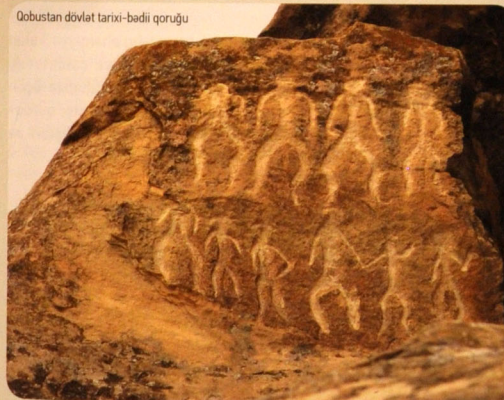
Qobustan dövlət tarixi-bədii qoruğu