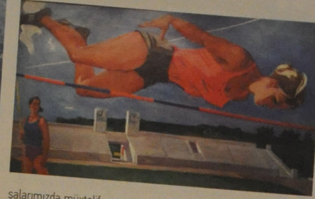
şalarımızda müxtəlif zaman, məkan forma, üslub təəssüratları yaradan bu sərgi iyunun sonunadək davam etdi.