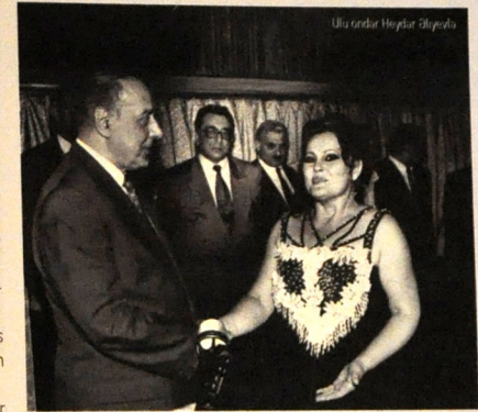
Ulu öndər Heydər Əliyevlə