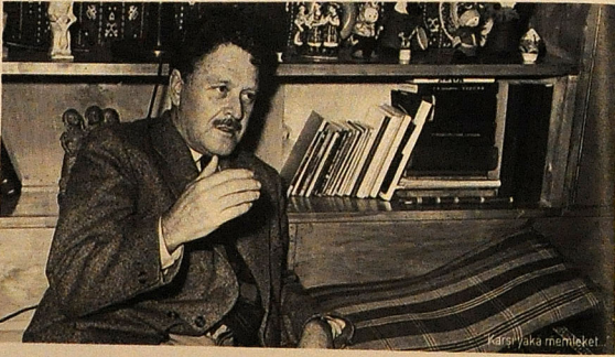
Karşı Yaka məhkəməti