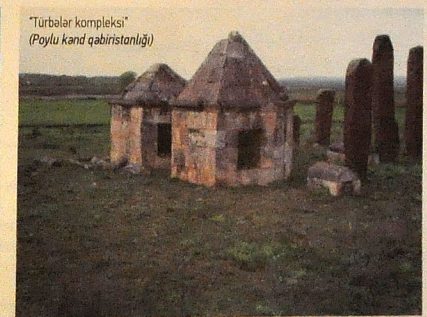
"Türbələr kompleksi" (Poylu kənd qəbiristanlığı)