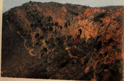
"Keşikçidağ" Dövlət Tarix və Mədəniyyət qoruğu ərazisində mağaralar

si olan daş dövrünə gedib çıxır. Qədim insanların öz əmək alətlərini əsasən çay daşından hazırladığı bu tarixi dövr ərzində bəşəriyyət böyük bir inkişaf dövrü keçmişdir.