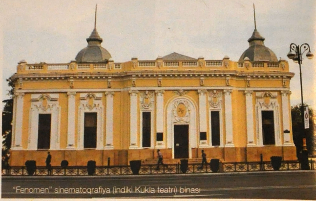
"Fenomen" sinematografiya (indiki Kukla teatri) binası

H.Z.Tağıyevin tikirdiyi teatr binası, Azərbaycan Dövlət Filarmoniyasının binası, Dənizkənarı parkda yerləşmiş Azərbaycan Dövlət Kukla teatrının binası, Hökumət evi, inşa edilmiş müxtəlif tipli yaşayış və inzibati binalar da misal göstərilə bilər. Azərbaycan müstəqillik qazandıqdan sonra da Bakı şəhərində şəhərsalma işləri davam etdirilmişdir. Müasir günümüzə ucaldıran hündürmərtəbəli binalarla yanaşı, inzibati