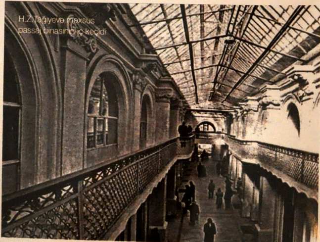
H.Z. Tağıyev Məxsus passajı binasının keçidi

Fasadların tərtibatında palmət motifindən də istifadə olunmuşdur. Qeyd etmək lazımdır ki, arxaik pal-