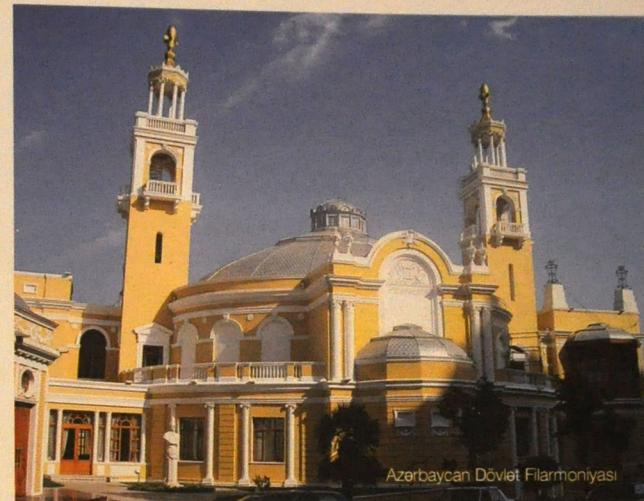
Azərbaycan Dövlət Filarmoniyası

li üslub və xüsusiyyətlərin təcəssümünə maneə olmurdur. Yerli memarlıq tikililərində, yaşayış binalarının kompozisiyalarında yüngül tipli eyvanlardan, tağvari pəncərələrdən çox istifadə edilirdi. Qeyd etmək lazımdır ki, XIX – XX əsrlərdə şəhər tikintisi əsasən Avropa memarlığı üzərində qurularkən, yerli kolorit məhz məscidlərin və hamamlar