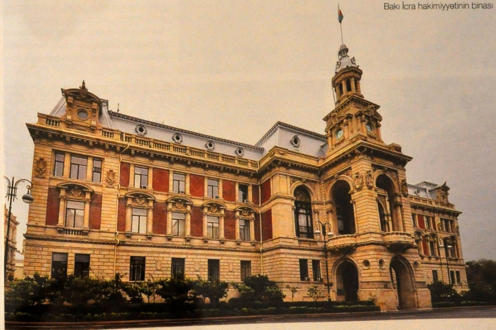
Bakı İcra hakimiyyətinin binası

XIX əsrin sonunda Azərbaycan memarlığında başqa cərəyanlarla yanaşı qotika da öz yerini tapır. Ondan ayrı-ayrı mülki tikililərin inşasında istifadə edilirdi. Bakıda qotika üslubunun tətbiq edilməsində o zamankı alman və polyak əhalisinin böyük rolu olmuşdur. Ən qotik bina köhnə Akademiya – İ-