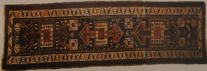
Xalça “Səlyan xiləsi”. Şirvan, Azərbaycan. XIX əsr.