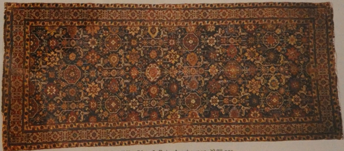
Xalça “Xile-Əfşan”. Bakı, Azərbaycan. XVIII əsr.