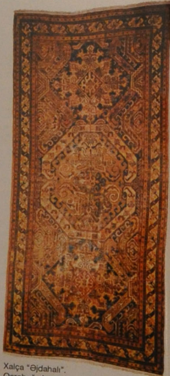
Xalça “Əjdahəli”. Qarabağ, Azərbaycan. XVII əsr.

Üçüncü mərtəbədə Azərbaycanın bütün xalçaçılıq məktəblərinə aid toxulu xalçalar, bədii tikmələr, milli geyimlər, zərgərlik nümunələri nümayiş olunur. Burada bütün mərtəbələrdə quraşdırılan monitorlarda “Azərbaycan xalçaları dünya muzeylərində” və “Azərbaycan xalçaları orta əsrlərdə Avropa rəssamlarının əsərlərində” adlı slayd-şou göstərilir.