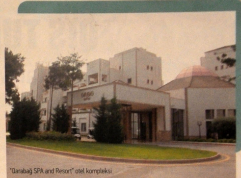
"Qarabağ SPA and Resort" otel kompleksi

Bununla yanaşı, Naftalan kurort zonasının daha da inkişaf etdirilməsi üçün xüsusi plan hazırlanır. Həmin plana əsasən, burada əlavə istirahət mərkəzləri, uşaqların valideynsiz istirahət etməsi üçün xüsusi şərait yaradılacaq. Yeni kottec və mehmanxanaların tikilməsi, 1,7 kilometr uzunluğunda kanat yolunun çəkilməsi, dünya standartlarına cavab verən qolf meydançasının, tennis kortunun, cıdır meydançasının yaradılması da nəzərdə tutulub. Gözlənilən digər irəliləyişlər Naftalanda beynəlxalq hava limanının tikintisidir. Bundan əlavə nəzərdə tutulub ki, Naftalan neftinin emalı, müalicəvi neftdən