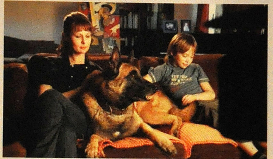
"Ağılımdakı kişi" ("Мужчина в моей голове")