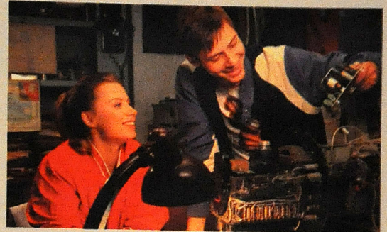
"Duzum Döllü kınılı idi və tez öldü" ("Дуэчка Дольли была злая и рано умерла")

– Sizin mədəniyyət və turizm naziri ilə bu barədə danışdıq. Bəzi fi-