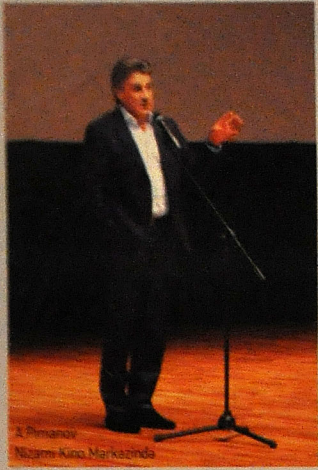
A. Pimanov Nəzəm Kurov Mərkəzində