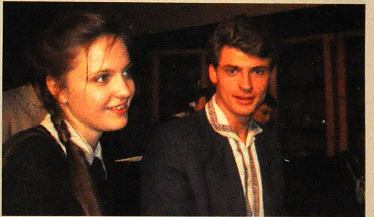
"Aleksandr bağı" ("Александровский сад")

kirlər var. Mən nəyin maraqlı ola biləcəyini anladım. Hesab ələyirəm ki, bura kinoya tamamilə uyğun məkəndi, Azərbaycanda mütləq kino çəkmək lazımdı. Təbiət, hava, dəniz, şəhərin özü hazır dekorasiyalardır. İkinci dünya müharibəsi ilə bağlı bir ideyamız var. Bir təklif də komediya çəkməkdə. Moskvadan kimsə gəlir və Bakıda komik situasiyalara düşür. Belə filmə Bakının bütün koloritini, insanlarını, adət-ənənələrini göstərmək olar. İsti və işıqlı bir əhvalat. Moskvaya qayıdan kimi fikirləşməyə başlayacağıq. ♣