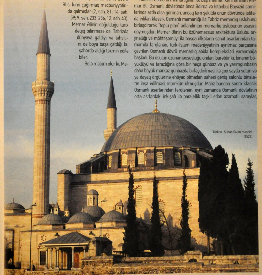
Türkiyə. Sultan Səlim məscidi (1522)

Klassik Osmanlı memarlığının ilk baş memarı kimi tanınan Memar Əli, Osmanlı dövlətində öncə Ədirnə və İstanbul Bayazid camilərində azda olsa görünən, ancaq tam şəkildə onun dövründə istifadə edilən klassik Osmanlı memarlığı ilə Təbriz memarlığı üslubunu birləşdirərək "toplular plan" adlandırılan memarlıq üslubunun əsasını qoymuşdur. Memar Əlinin bu özünəməxsus arxitektura üslubu orijinallığı və möhtəşəmliyi ilə başqa ölkələrin sənət əsərlərindən tamamilə fərqlənən, türk-İslam mədəniyyətinin ayrılmaz parçasına çevrilən Osmanlı dövrü memarlıq abidə kompleksləri yaratmağa başladı. Bu üslulun özünəməxsusluğu ondan ibarətdir ki, binanın böyüklüyü və tarazlığına görə bir neçə günbəz və ya yarımgünbəzin daha böyük mərkəz günbəzdə birləşdirilməsi ilə çox sayda sütun və ya dayaq örgülərinə ehtiyac olmadan sahəsi geniş salonlu binaların inşa edilməsi mümkün olmuşdur. Məhz bundan sonra klassik Osmanlı əsərlərindən fərqlənən, eyni zamanda Osmanlı dövlətinin orta əsrlərdəki inkişafı ilə paralellik təşkil edən azmətlili saraylar,