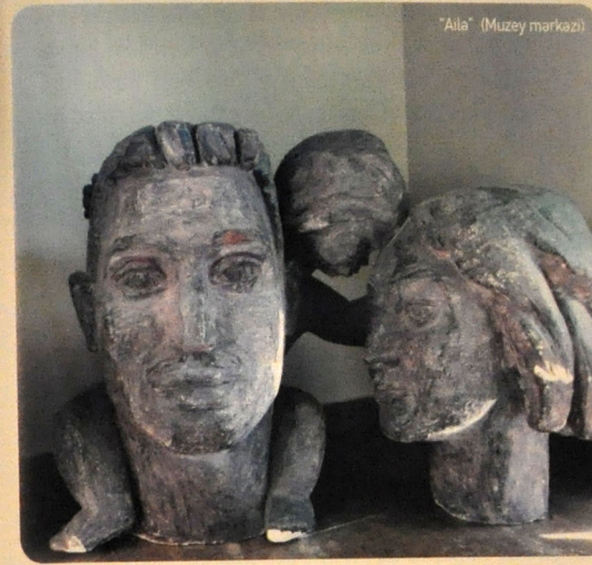
"Ailə" (Muzey markazı)

“Daşdan yonulmuş "Analıq" (1967) əsəri heykəltəraşın ən uğurlu işlərindəndir. Burada başlarını dik tutmuş ana və onu qucaqlayaraq yuxuya getmiş şirin körpəsi təsvir olunur. Daxili hərəkətə əsaslanan kompozisiya dəqiq cizgiləri, ifadəli silueti ilə seçilir. Yumşaq yapma üslubunun keçirdiyi hissələrlə uyşur. Bu kompozisiya müəllifin bədii forma sahəsindəki novator axtarışlarının əyani nümunəsidir. (1, səh. 8).