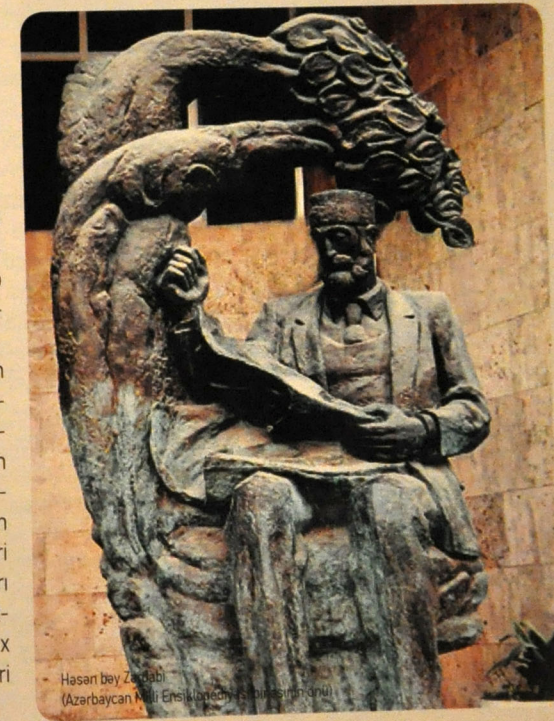
Hasan bəy Zərdabi (Azərbaycan Milli Ensiklopediyasının əsası)