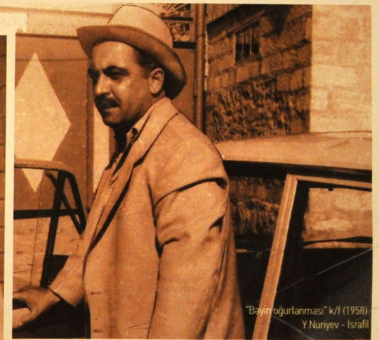
"Bəni ögürünməsi" k/f (1958). Y. Nuriyev - İsrail