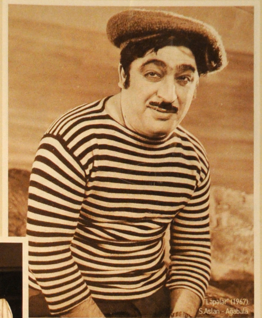
"Lapalı" (1967) S.Aslan - Ağabala.

("Höcət eləmə"), Aslan ("Bizə bircə xal lazımdır"), Şəkərli ("Axırı yaxşı olar"), Qüdrət Səda ("Hardasan, ay subaylıq?"), Şakir ("Dağlar qoynunda"), Türbətəli ("Təzə gəlin"), Tofiq ("Ev bizim, sirr bizim") və sair və ilaxır. Lakin həmin surətlərin rol kimi səhnə təqdimatlarının bədii miqyasları geniş, estetik dayarları çoxqatlıdır.