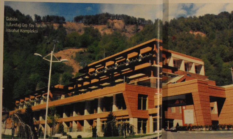
Qabala, Tufandağ Qış-Yay Turizm İstirahət Kompleksi