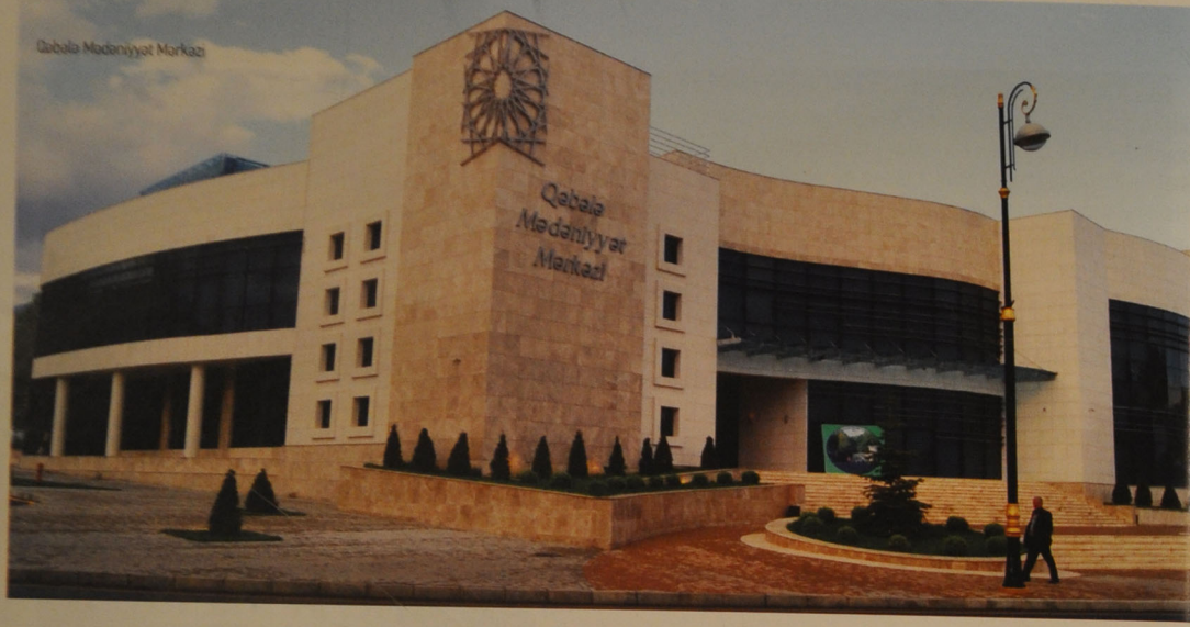
Qabala Mədəniyyət Mərkəzi

Reallaşdırılan böyük quruculuq, yenidənqurma və abadlıq tədbirləri Qəbələnin də simasını tamamilə dəyişib, onu daha da füsunkar edib. Burada yeni tikililərin, əsaslı bərpadən sonra görkəmini inanılmaz dərəcədə dəyişən obyektlərin, mədəniyyət və turizm müəssisələrinin adlarını sadalamaqla qurtaran deyil: Heydər Əliyev Mərkəzi, tarix-diyarşünaslıq muzeyi, mərkəzi kitabxana, ulu öndərin adını daşıyan park, rayon mədəniyyət mərkəzi, "Qafqaz Resont", "Qafqaz Sport", "Qafqaz Karvansaray" beşulduzlu otelləri və s.