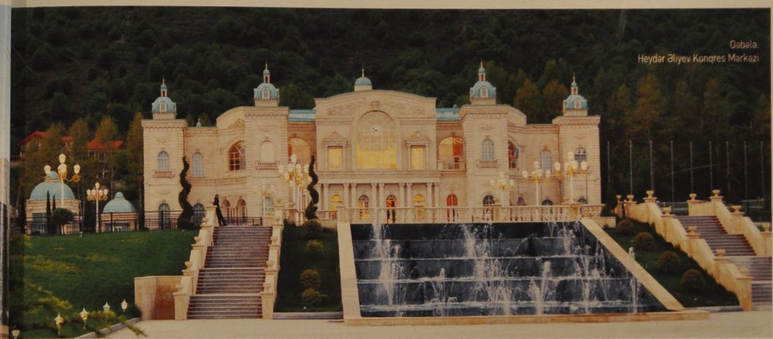
Qabala, Heydər Əliyev Konqres Mərkəzi