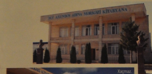
Xaçmaz. Mərkəzi kitabxana