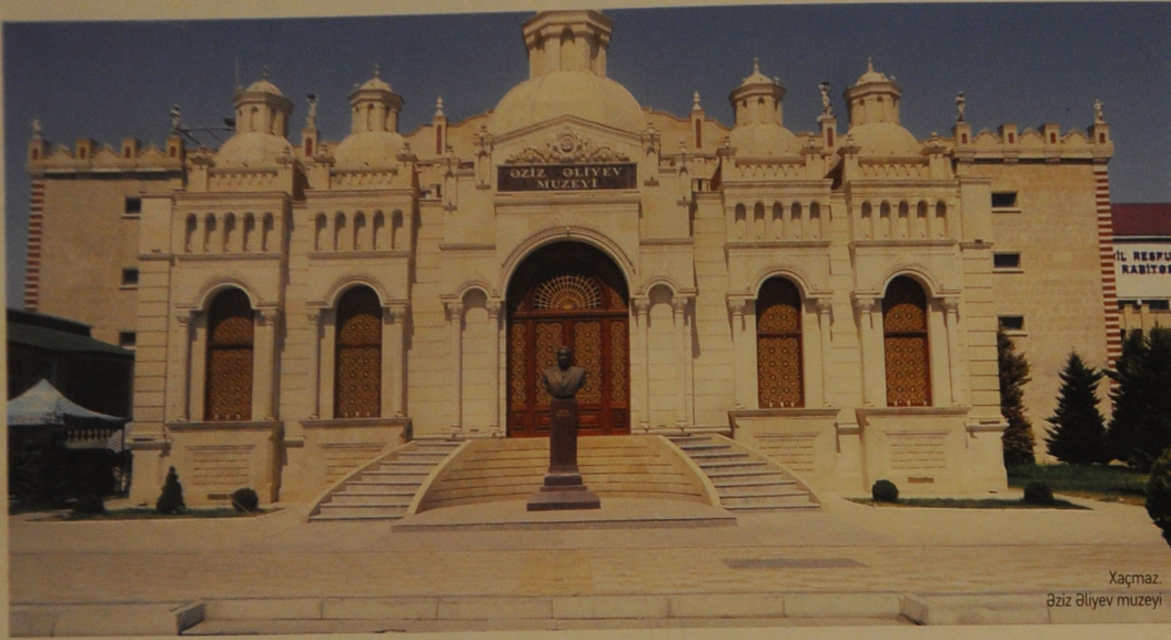
Xaçmaz. Əziz Əliyev muzeyi

Bölgədə ərsəyə gətirilən müasir tipli tikililərdən biri də Xaçmaz Rayon Mədəniyyət və Turizm Şöbəsinin binasıdır. Bina iki mərtəbədən – foye, iş otaqları, iclas və konfrans zallarından ibarətdir, müasir istilik sistemi ilə təchiz edilib. Rayon uşaq və gənclər kitabxanası da öz xarici görünüşü ilə diqqət çəkir. Bina önündə Abbas Səhhat, Seyid Əziz Şirvani, Abdulla Şaiq və Süleyman Sani Axundovun abidələri ucaldılıb.