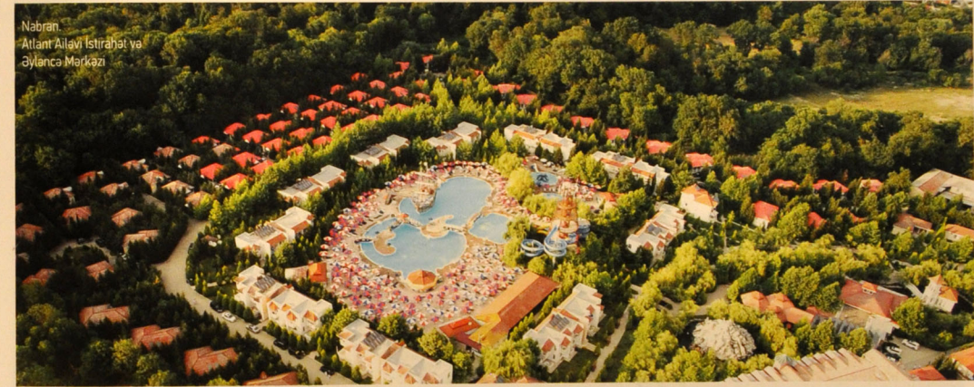
Nabran Atlant Ailəsi İstirahət və Böyləncə Mərkəzi

Bu xoş sözləri Xaçmazın ünvanına da şamil etməliyik. Bu gözəl diyara yolu düşənlər hər dəfə burada böyük quruculuq və yenidənqurma işlərinin şahidi olurlar. Bölgədə reallaşdırılan bir-birindən möhtəşəm layihələr rayonu daha da füsunkar edib. Təsadüfi deyil ki, uca dağları, Xəzər dənizi boyunca uzanan meşələri, zəngin təbiəti, özünəməxsus mətbəxi və adət-ənənələri ilə seçilən bu regiona gələn turistlərin sayı ildən-ilə artır. İnsanları heyrləndirən və fərəhləndirən odur ki, bütün bu köklü dəyişikliklər çox da böyük olmayan zaman kəsiyində gerçəkləşdirilib.