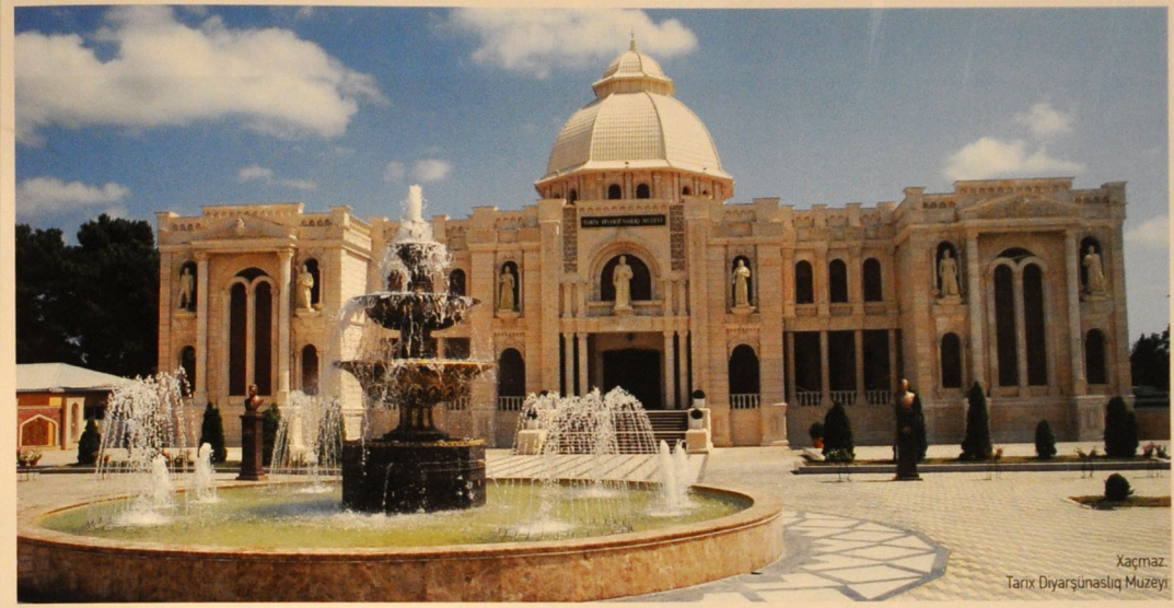
Xaçmaz, Tarix Diyarşünaslıq Muzeyi