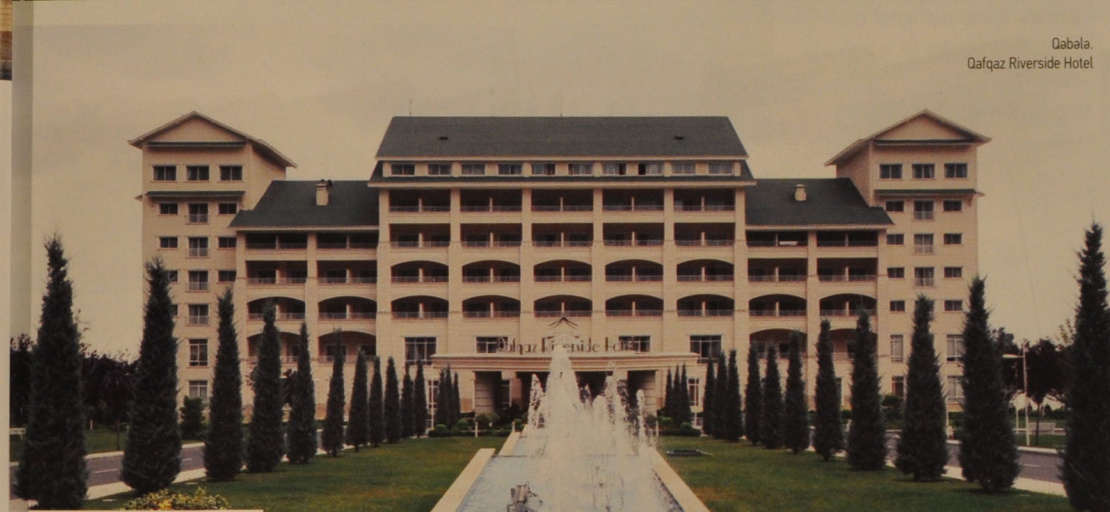
Qabala, Qafqaz Riverside Hotel