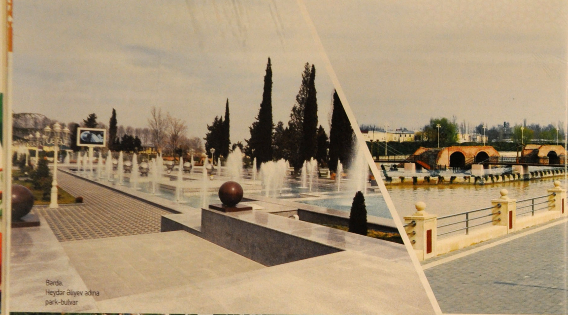
Barda, Heydar Əliyev adına park-bulvar