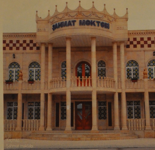
Xaçmaz. Səhhat məktəbi

Füzuli ilə bağlı qeydlərimizə də açılış mərasimində Azərbaycan Prezidenti İlham Əliyevin iştirak etdiyi su elektrik stansiyasından başlamaq istərdik. Füzuli SES Böyük Mil Kanalı üzərində qurulub. 14 hektar ərazini əhatə edir. Ümumi gücü 25,2 meqavatdır. 0, rayondakı 110 kilovatlq "Harami" yarımstansiyası vasitəsilə respublikanın enerji sistemində birləşdirilərək paralel rejimdə işləyir.